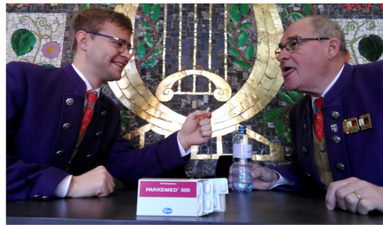
DIE ALTE MARSCHTROMMEL LASTET SCHWER AUF DEN SCHULTERN